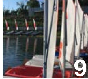
Le centre nautique fait peau neuve

Maire de Verneuil-sur-Seine Président de la Communauté urbaine Grand Paris Seine & Oise