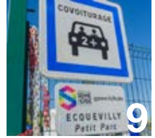
La vallée de la Seine à coups de pédale